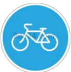
4.4.1 «ВЕЛОСИПЕДНАЯ ДОРОЖКА»