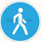
4.5.1 «ПЕШЕХОДНАЯ ДОРОЖКА»