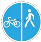
4.5.4 «ПЕШЕХОДНАЯ И ВЕЛОСИПЕДНАЯ ДОРОЖКА С РАЗДЕЛЕНИЕМ ДВИЖЕНИЯ»