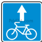
5.14.2 «ПОЛОСА ДЛЯ ВЕЛОСИПЕДИСТОВ»