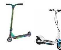
Самокат/ электрический самокат

(ПОДГОТОВЛЕНО ОГИБДД МО МВД РОССИИ «БОРОДИНСКИЙ»)