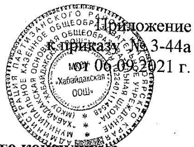
График работы психолого-педагогического консилиума МКОУ «Хабайдакская ООШ»